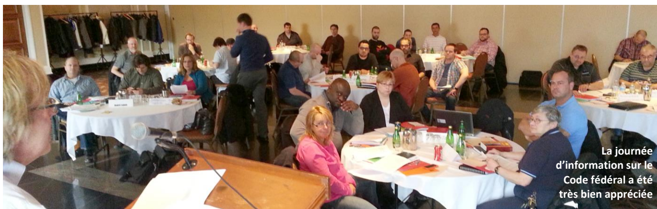
La journée d'information sur le Code fédéral a été très bien appréciée